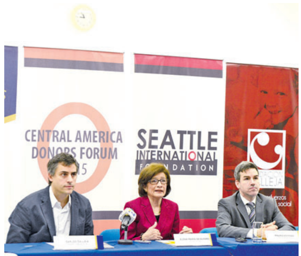
Fundación Calleja será uno de los patrocinadores del Foro regional.